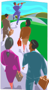
Suivre = to follow